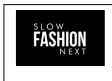
SLOW FASHION NEXT